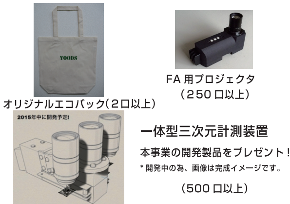
オリジナルエコバック(2口以上)